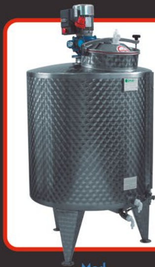
Mod. MY 600A l. 600 MY 1000A l. 100